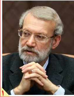
پیرامون دیدار رئیس پیشین مجلس با رئیس‌جمهور