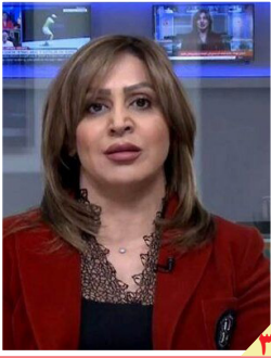
اتفاق نادر در فضای سیاسی بغداد؛

روزنامه سیاسی، اقتصادی، اجتماعی و فرهنگی صبح ایران