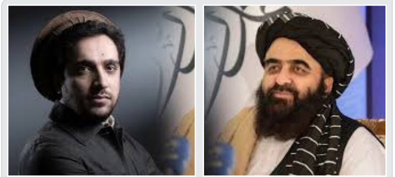
ملاقات احمد مسعود با طالبان تأیید شد

همدلی رهبر انقلاب در دیدار با مردم قم به مناسبت سالروز واقعه ۱۹ دی درباره موضوع مذاکره هم سخن گفتند. مذاکرات هسته‌ای ایران سال‌هاست که در فضای سیاسی کشور محل مناقشه احزاب و گروه‌های مختلف است. بخشی از نیروهای سیاسی طی سال‌های گذشته بارها با طرح دلایل گوناگون تأکید داشتند که هرگونه مذاکره برخلاف مصالح کشور است در حالی که روز گذشته رهبر انقلاب در آخرین سخنرانی خود